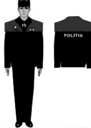
UNIFORMA DE SERVICIU BLUZA CU MANECI DETASABILE

NOTA: SE VA UTILIZA DE TOTI POLITISTII (DIN CORPUL OFITERILOR SI AGENTILOR DE POLITIE) CA ALTERNATIVA IN PERIOADELE DE TRECERE IARNA - PRIMAVARA SI TOamna. IARNA CAND NU SE POATE PURTA COMPLETUL MODULAR SAU BILIONAL SIMPLU